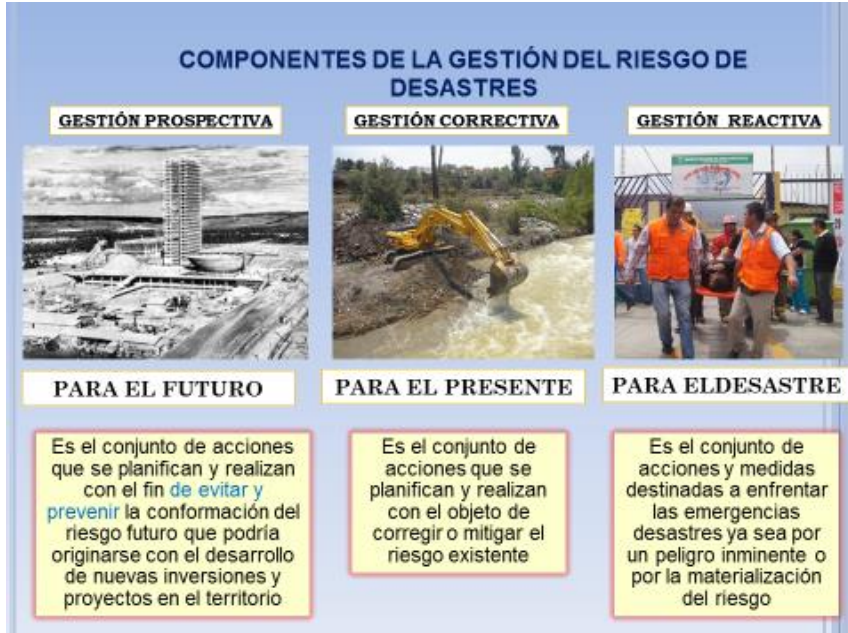
GRÁFICO Nº 1 GESTION DE RIESGO DE DESASTRES: COMPONENTES

estrategias y acciones en todos los niveles de gobierno y de la sociedad con la finalidad de proteger la vida de la población y el patrimonio de las personas y del Estado 33 .